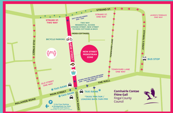
New Street, Malahide - Pedestrian Zone 11am - 6am